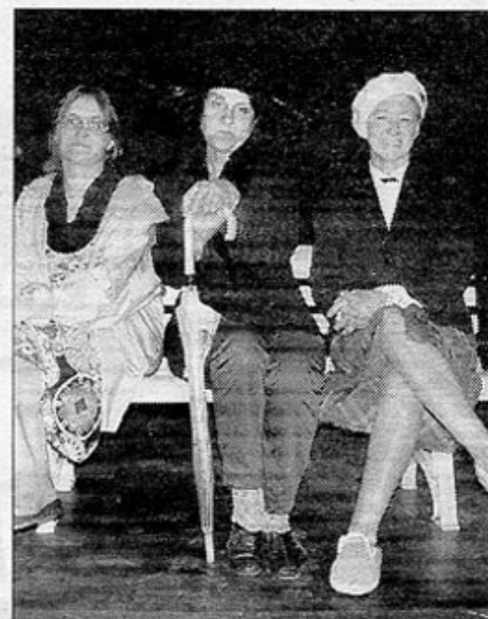
Les trois actrices d'« Ouvrage de dames ».

D'autre part, Le Théâtre du Lys ouvre un atelier théâtre à partir du jeudi 14 octobre, au centre