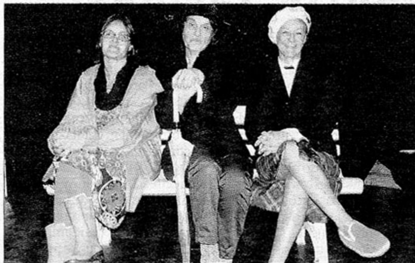
« Ouvrage de dames » drôle et décapant.